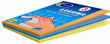
13043 LAGUNA 3