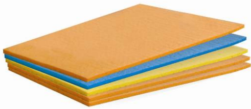
13045 LAGUNA 5