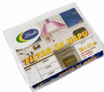
13065 FILTAR ZA NAPU