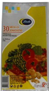
13302 VREĆICE ZA DOMAĆINSTVO 2L;3L;5L